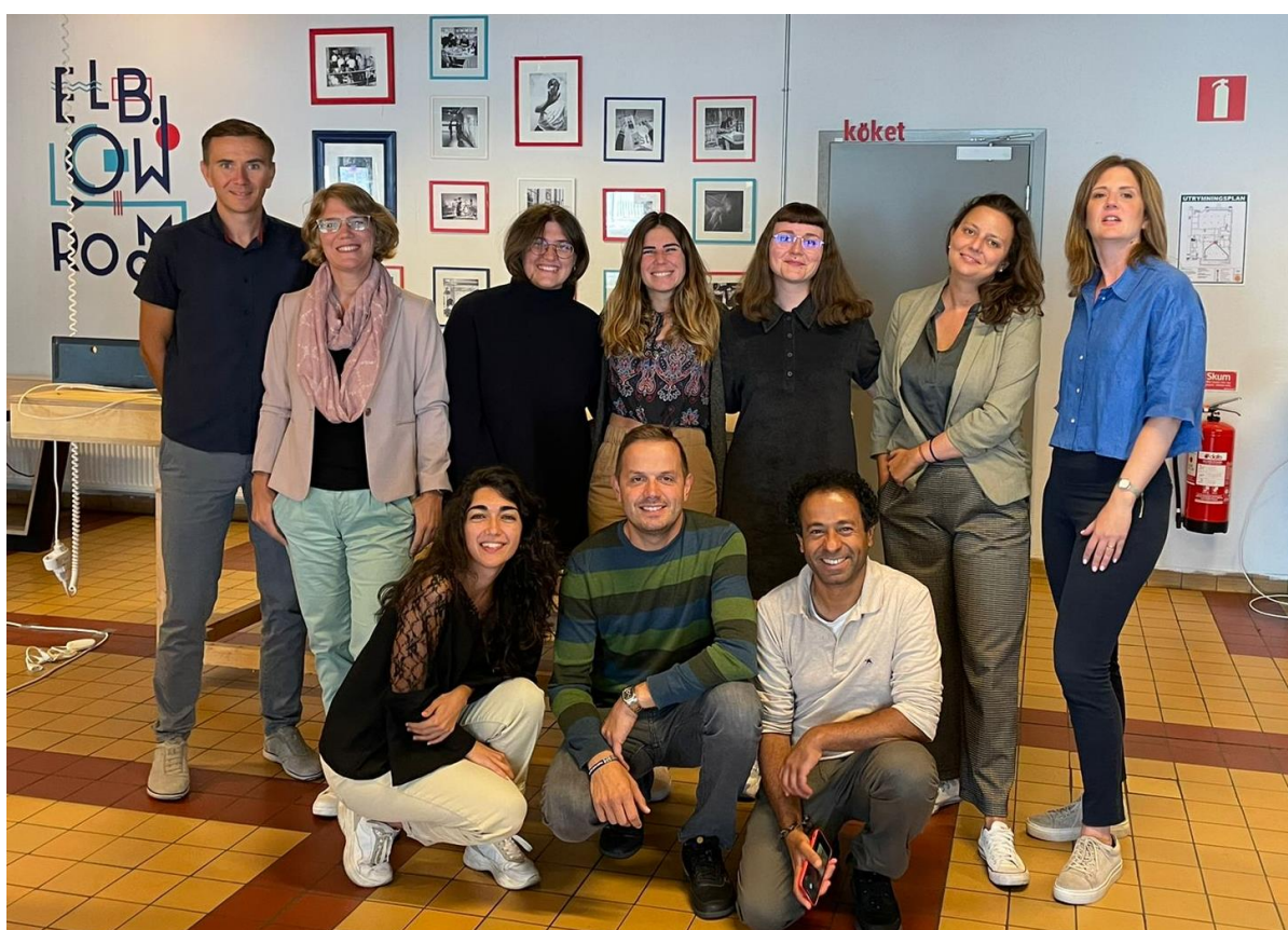
Partnerji v projektu CONVOLUT, Malmö, 31. avgusta 2022